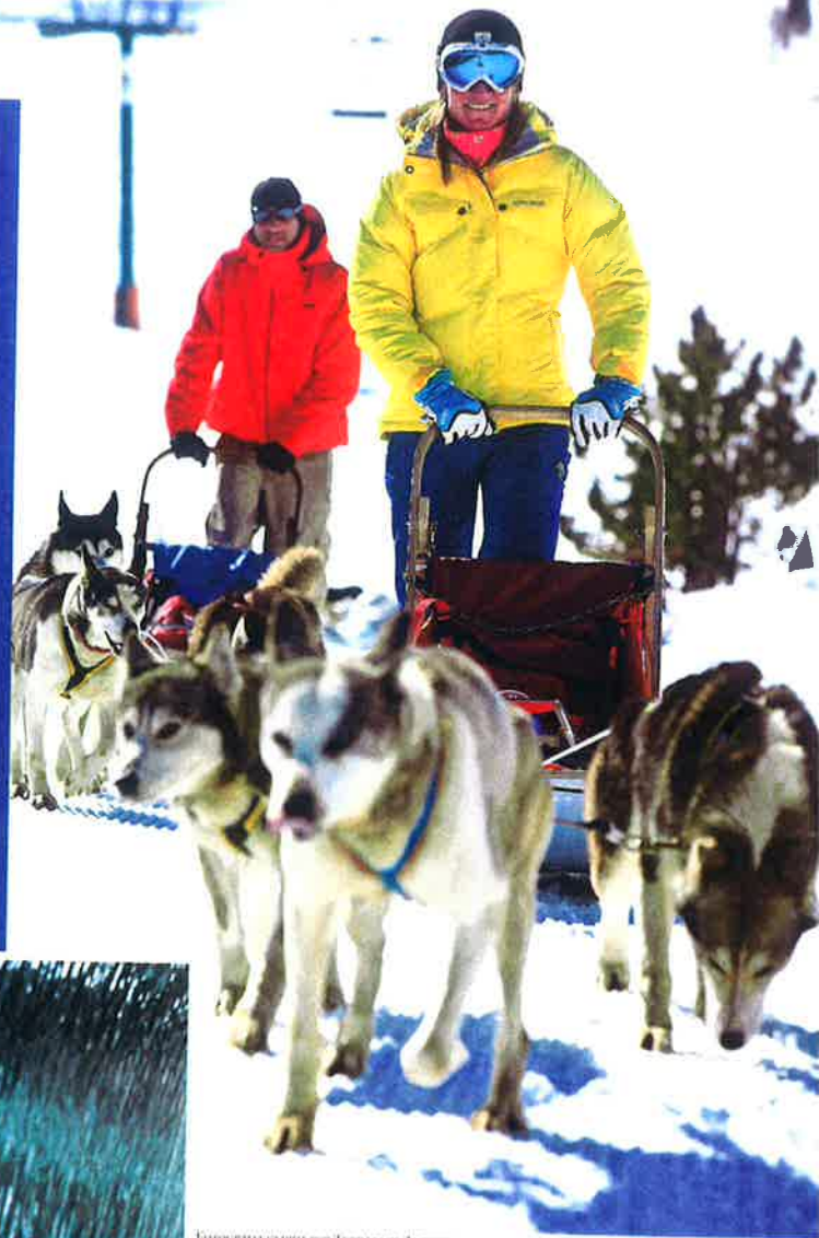
ESTACIONES CLUBS POR TERRAZO DE ANDORRA

de año, fechas que la gente aprovecha para salir y disfrutar con la familia, y ambas son consideradas temporada alta", explica la experta en turismo de esquí, que añade y confirma que todos los fines de semana de invierno son temporada alta, así como las festividades o Semana Santa.