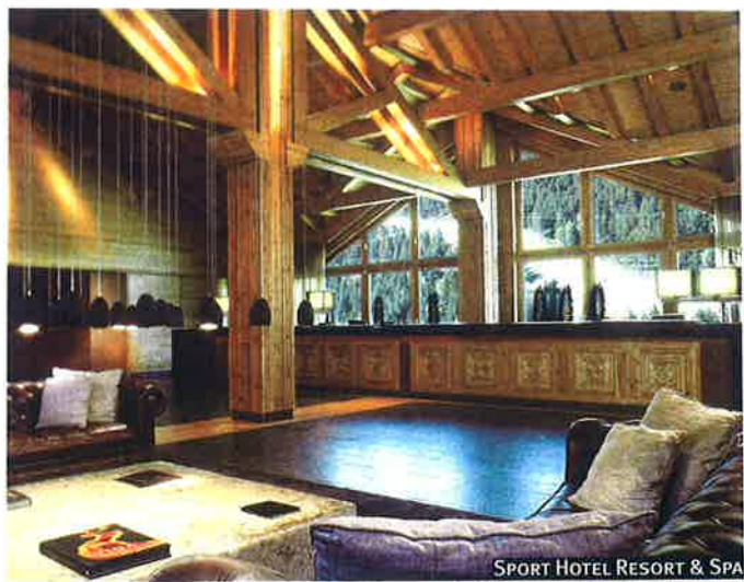
SPORT HOTEL RESORT & SPA

UN BUEN HOTEL DE MONTAÑA DEBE SER CÁLIDO Y ACOGEDOR, HACIENDO ÚNICA LA EXPERIENCIA DE ALOJARSE EN ÉL.