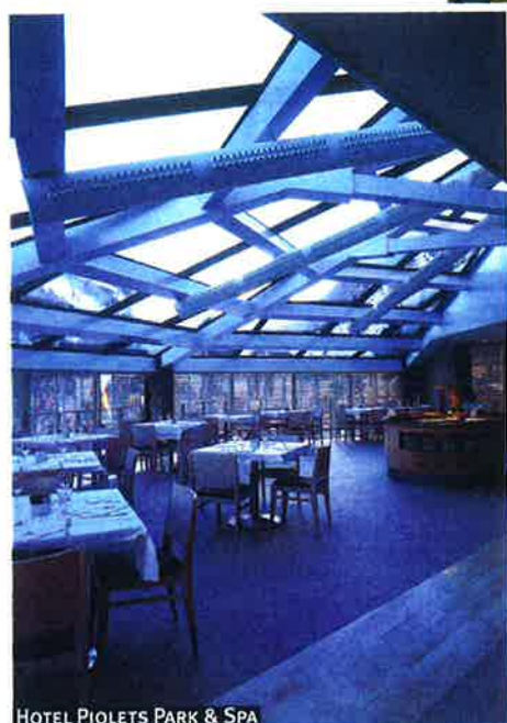
HOTEL PIOLETS PARK & SPA

UN BUEN HOTEL DE MONTAÑA DEBE SER CÁLIDO Y ACOGEDOR, HACIENDO ÚNICA LA EXPERIENCIA DE ALOJARSE EN ÉL.