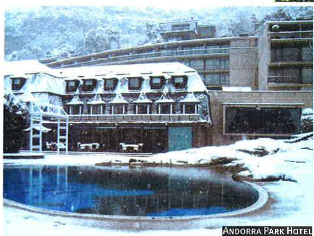
ANDORRA PARK HOTEL

LOS MÁS AFICIONADOS VIAJAN DURANTE INVIERNO PARA PASAR UNOS DÍAS DE DIVERSIÓN Y RELAX PRACTICANDO ESTE DEPORTE, CON TODO LO QUE LLEVA ASOCIADO: NATURALEZA, MONTAÑA, SOL, EXCURSIONES Y DESCANSO.