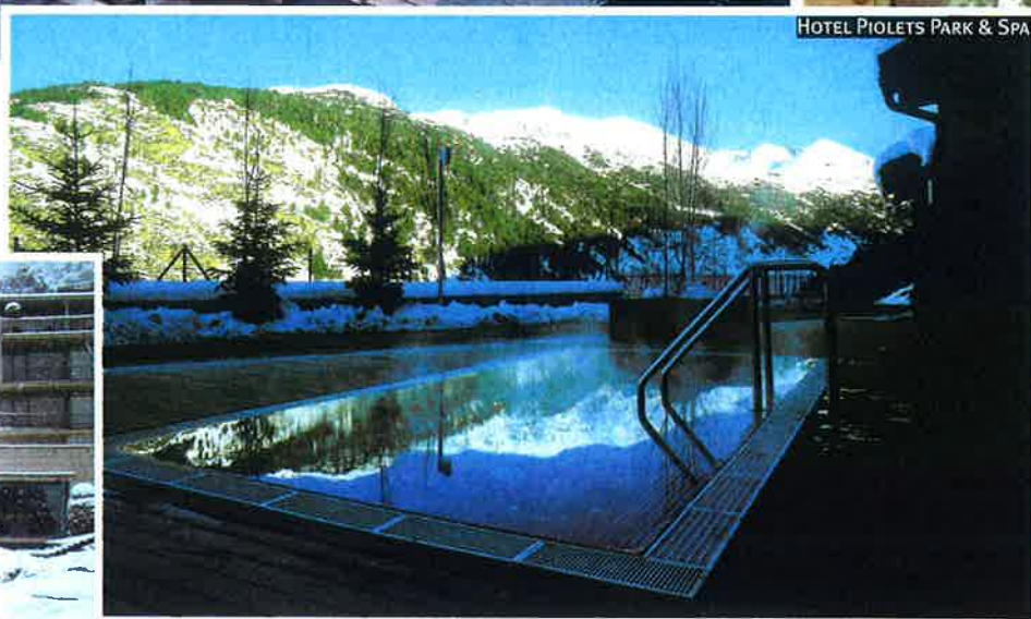
HOTEL PIOLETS PARK & SPA